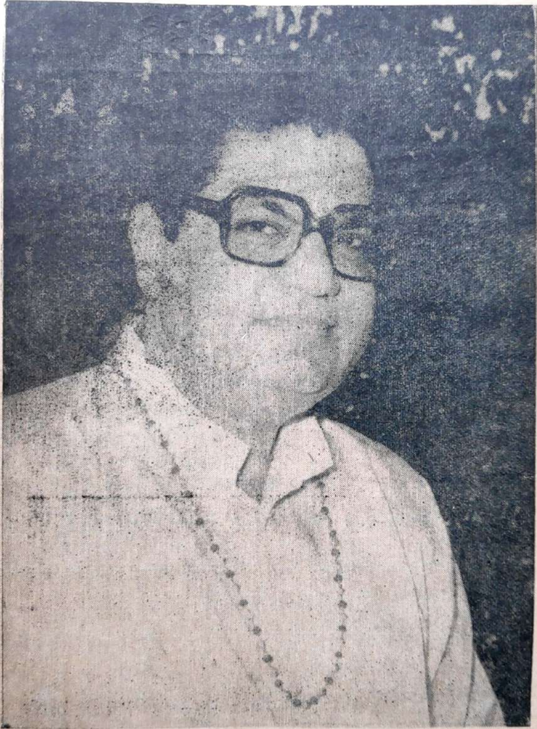
પ્રખર ગાયત્રી-ઉપાસક પૂ. શ્રી શાસ્ત્રીજી