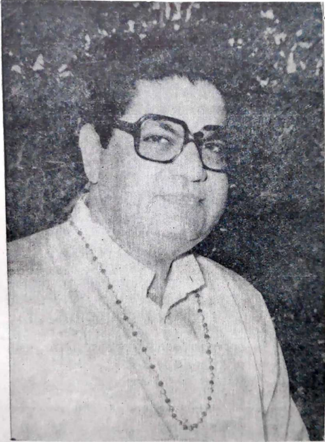
પ્રખર ગાયત્રી-ઉપાસક પૂ. શ્રી શાસ્ત્રીજી