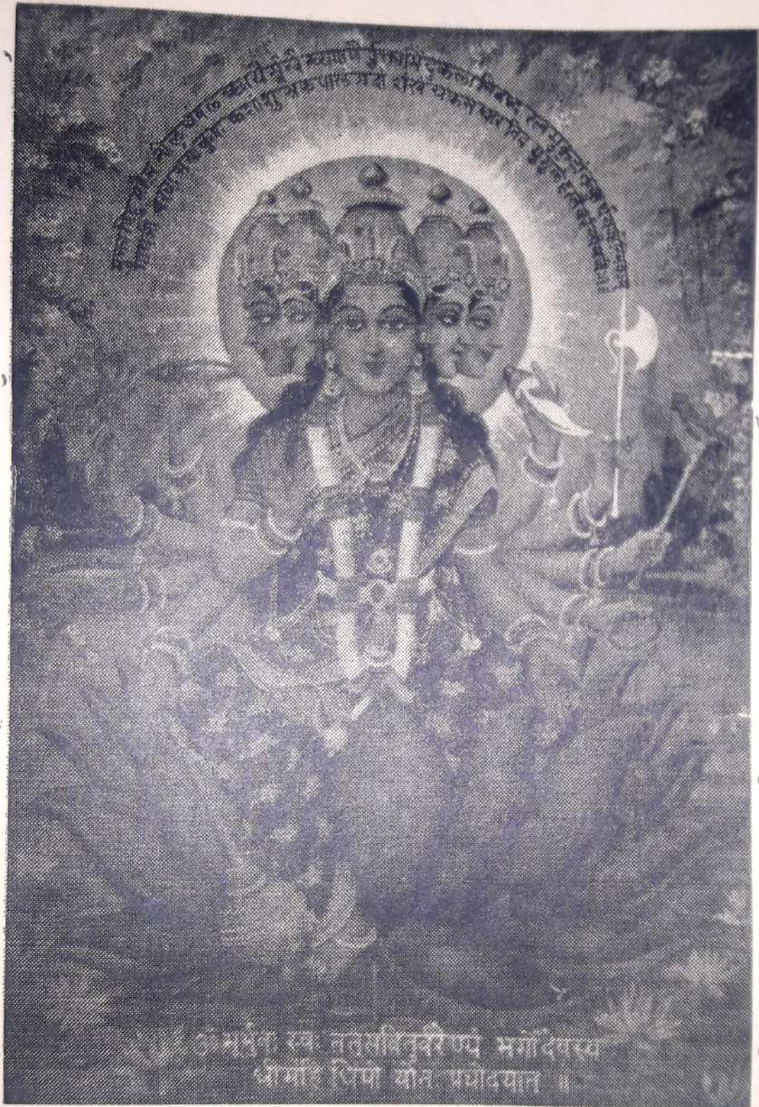
परम तेजदात्री मा गायत्री