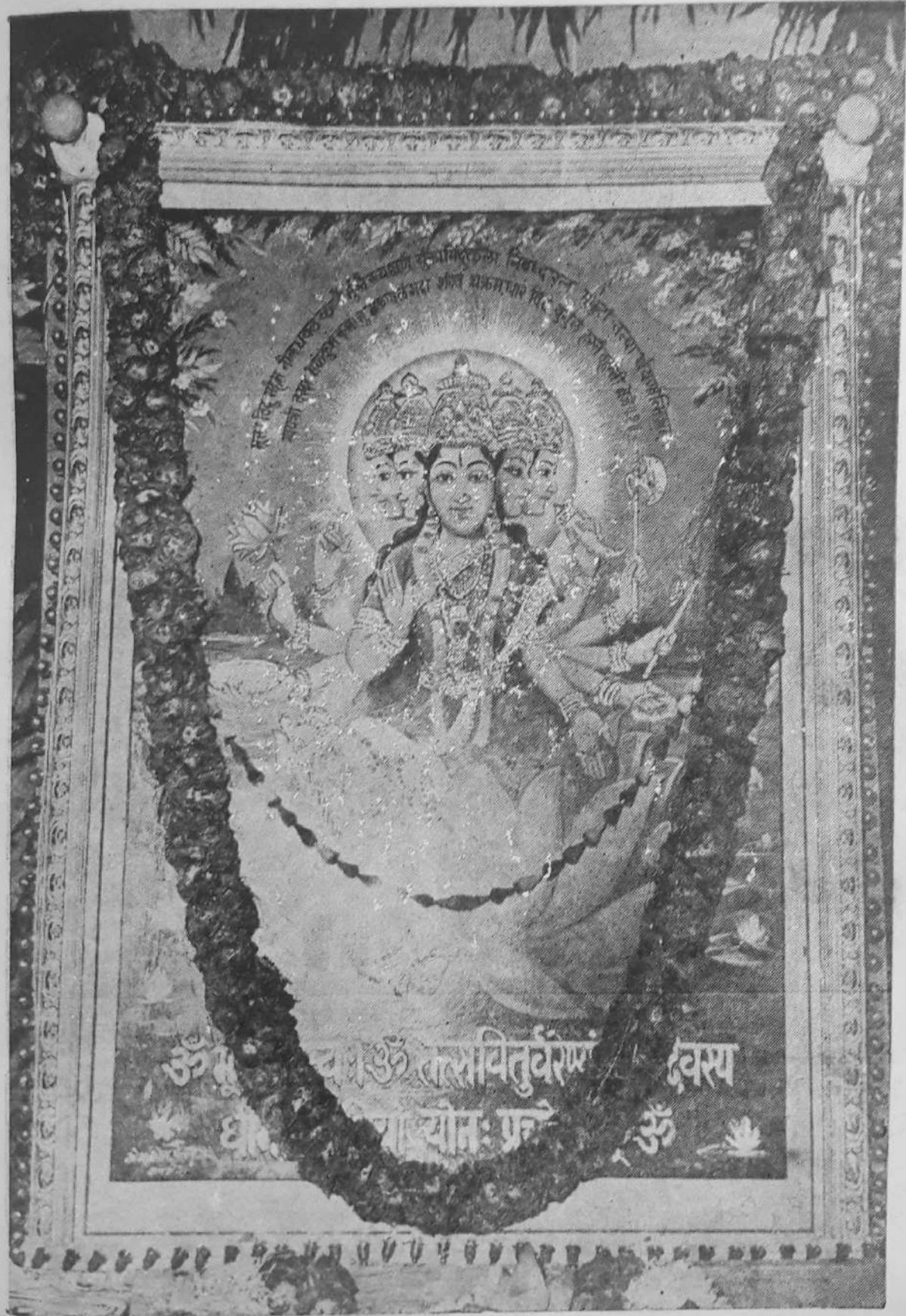
परम तेजदात्री मा गायत्री