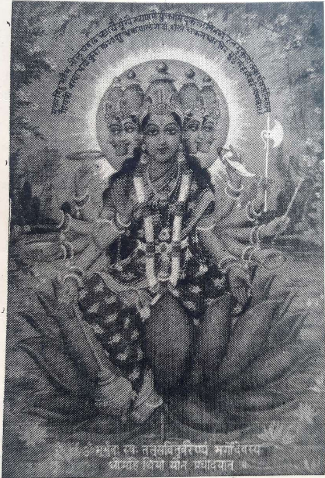
परम तेजद्वत्री भा गायत्री