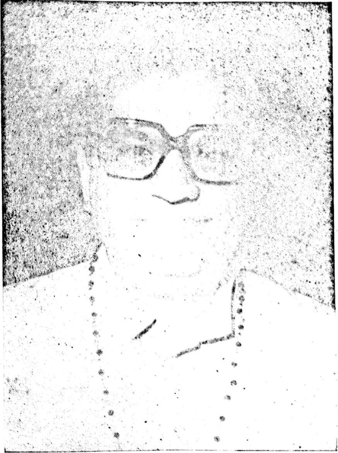
गायत्री-डिपार्टमेंट पृ. भी शास्त्री