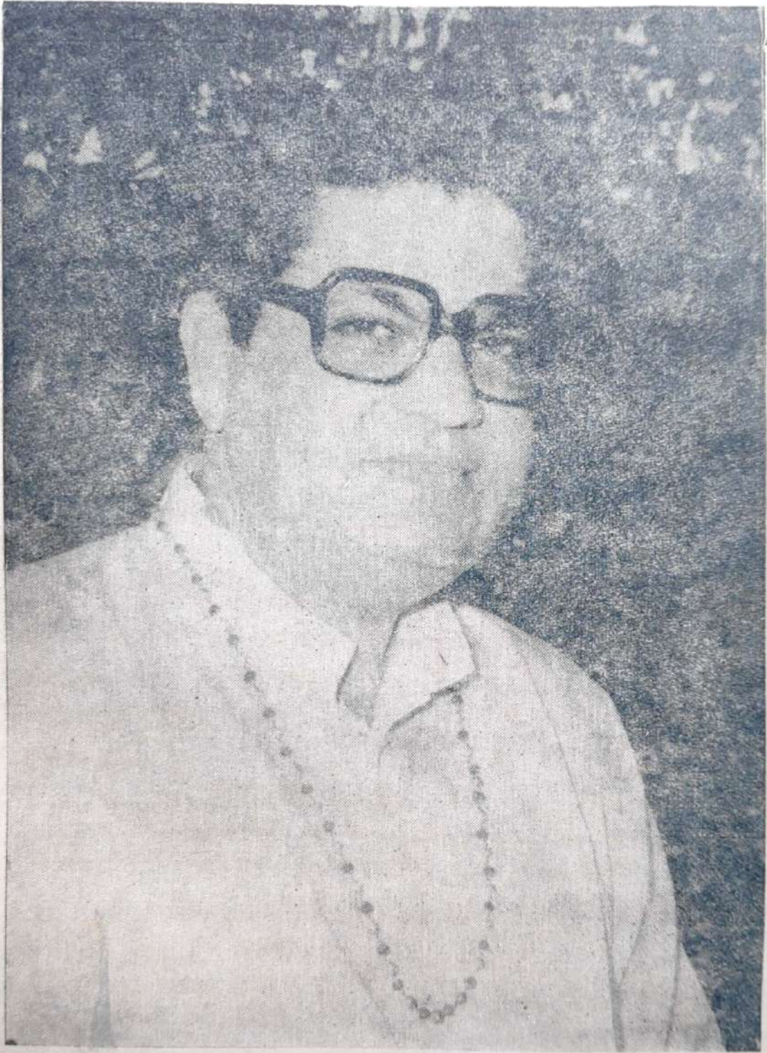
પ્રખર ગાયત્રી-ઉપાસક પૂ. શ્રી શાસ્ત્રીજી