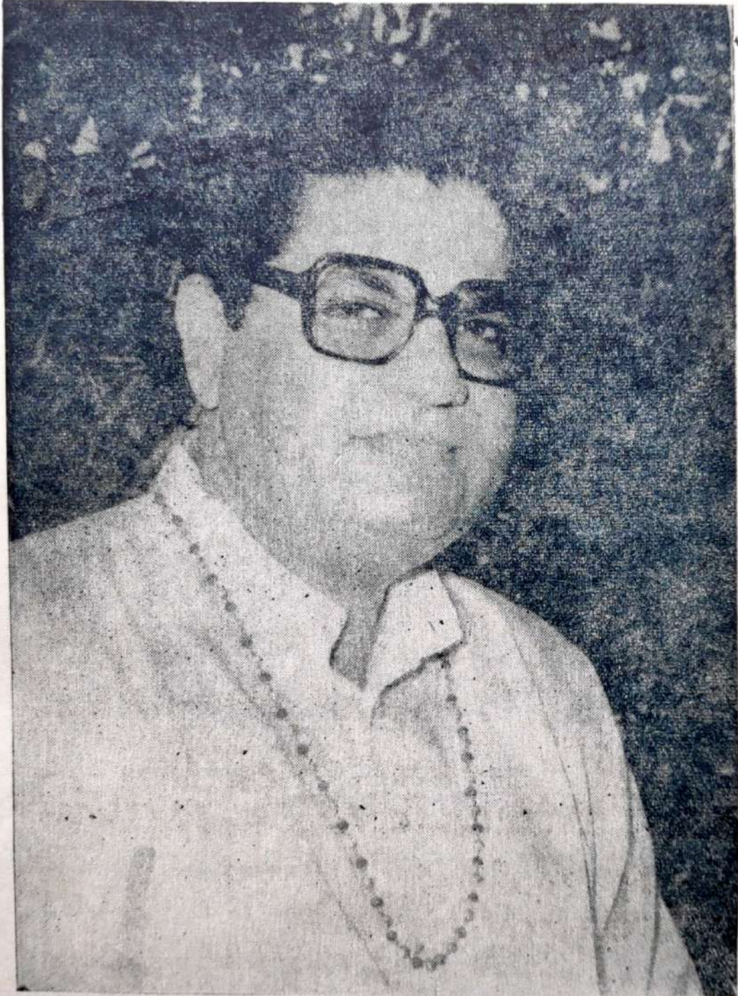
प्रणर गायत्री-डपासक पू. श्री शास्त्रील